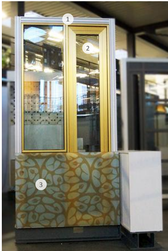
Vorderansicht Front elevation