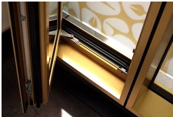
Detail Drehfenster Detail turn window

Fixed glazing and window glazing, triple insulated glazing 36 mm